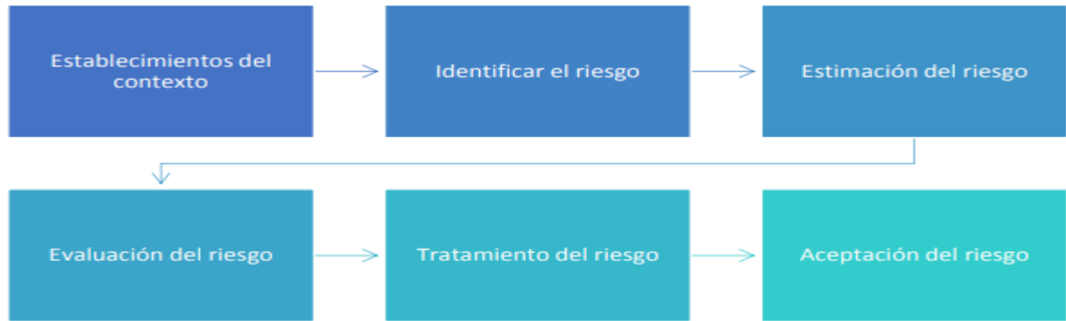
Ilustración 1. Estructura general de la metodología de riesgos